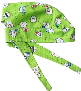
DENTAL CARE Dental Care cod. 18