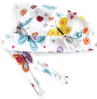
FARFALLE Butterflies cod. 07