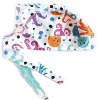
POLIPETTI Octopuses cod. 06