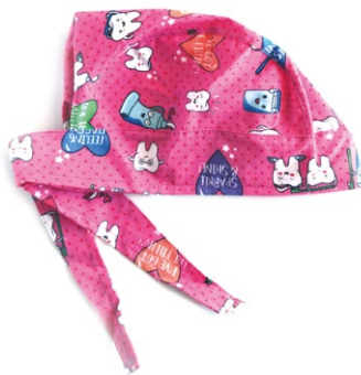
DENTI FELICI Happy teeth cod. 03