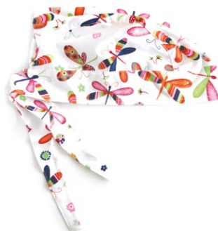
LIBELLULE Dragonflies cod. 08