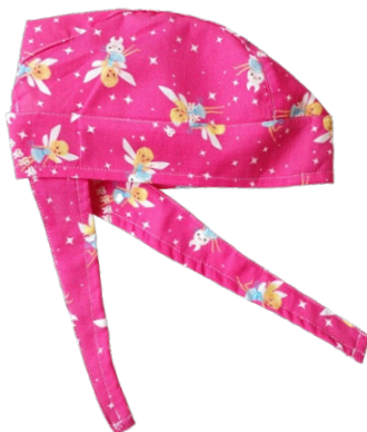
FATINE Tooth fairies cod. 19