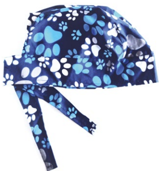
ZAMPETTE Paws cod. 02