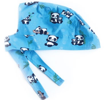
PANDA Pandas cod. 15