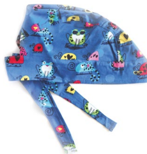
TARTARUGHINE Turtles cod. 14