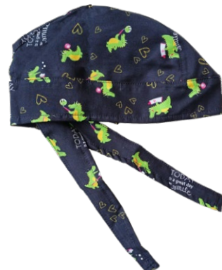
COCCODRILLI Crocodiles cod. 20