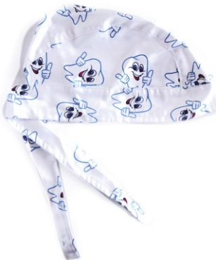
DENTINI Small teeth cod. 09