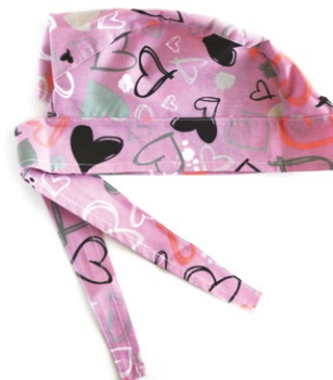
CUORI ROSA Pink hearts cod. 04