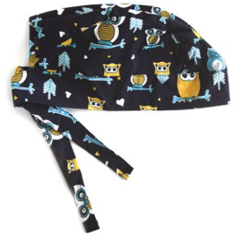
GUFETTI Owls cod. 01