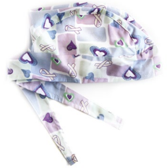
NASTRI Ribbons cod. 05